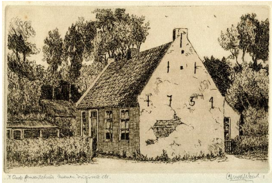
raadhuis Nuenen-Gerwen (ets Cor van der Woerd)