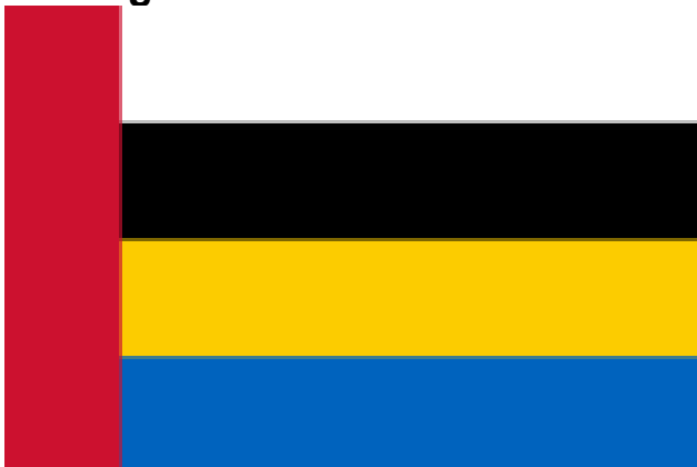
gemeentevlag Nuenen, Gerwen en Nederwetten