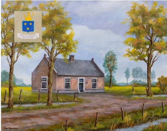
raadhuis Nederwetten-Eckart (schilderij Jan Vlemmix)