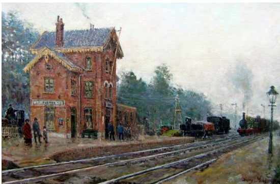
station Nuenen (schilderij Harry Maas)

De tot Nuenen behorende kern Eeneind heeft zich vanaf 1866 ontwikkeld rond het voormalige station-Nuenen.